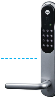
Yale Doorman med ZigBee modul